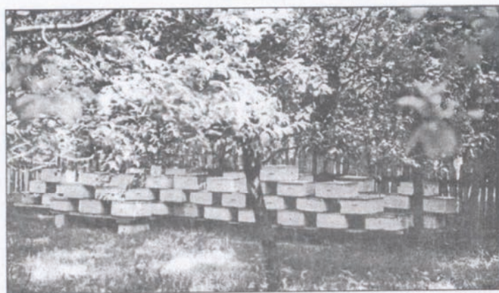
Сл. 80. Нуклеуси са зајвореним летима и замреженим отворима са доње стране сложени у хладовину пре зајрашавања комараца. Пре налетања авиона нуклеусе прекријем пластичном фолијом.

вани. У таквим ситуацијама ја пчелињак не селим, него пчеле затварам а горњу вентилацију потпуно отварам. Пред налетање авиона кошнице прекривам пластичном фолијом, коју након два-три сата уклањам, али лета не отварам до потпуног смркавања.